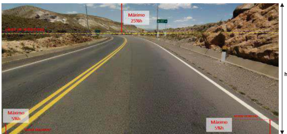
B Visualización aceptada (con vista de carril)