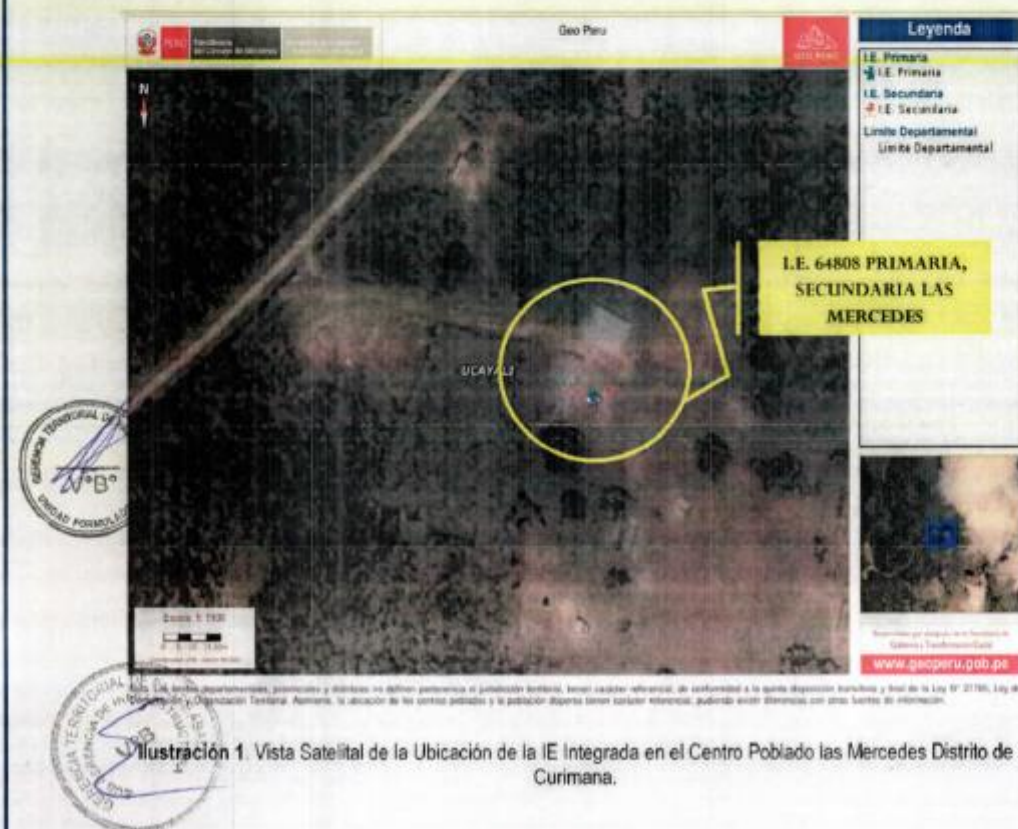
Ilustración 1. Vista Satelital de la Ubicación de la IE Integrada en el Centro Poblado las Mercedes Distrito de Curimana.