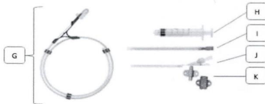
Figura 1. Catéter triple lumen (No incluye diseño)

G: Guía; H: Jeringa; I: Dilatador; J: Aguja introductora; K: Fijador de sujeción