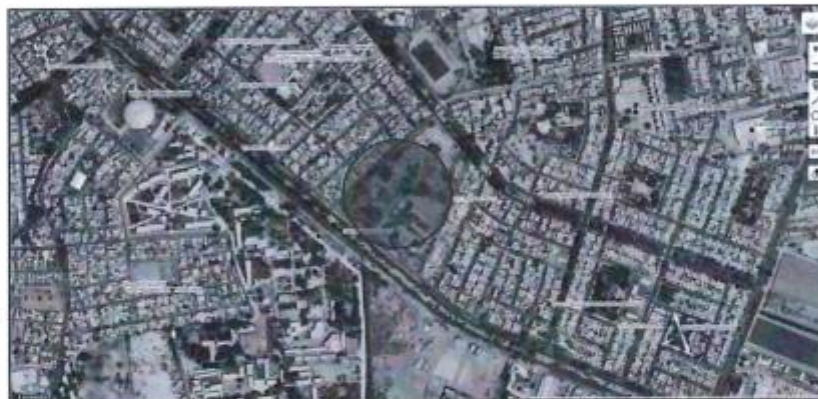
Ubicación de la institución educativa nivel secundaria José Toribio Polo – distrito de Ica, provincia de Ica, departamento de Ica.

La Institución educativa nivel secundaria José Toribio Polo, se encuentra ubicado en el distrito de Ica, provincia de Ica, departamento de Ica, cuyo terreno se encuentra inscrito en los registros públicos con uso a favor del Ministerio de Educación en la partida N°02002434, con un área de 52,404.62 m2.