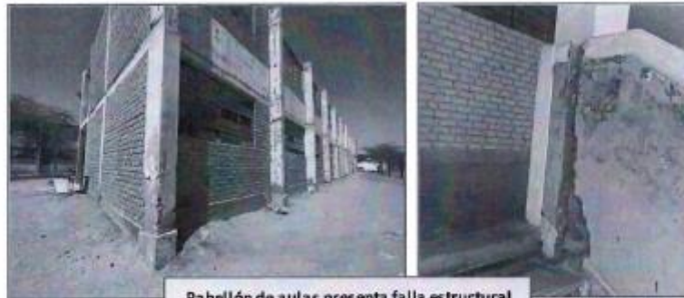
Pabellón de aulas presenta falla estructural