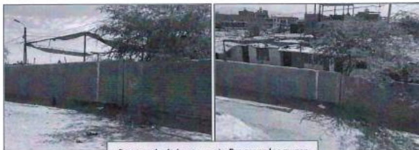
Cerco perimétrico presenta fisuras en los muros