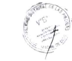
CUADRO N° 02 ÁMBITO DEL PROYECTO

El ámbito del proyecto debe estar definido por una poligonal cuyos puntos serán definidos en coordenadas UTM (WGS84) y altitud sobre el nivel del mar, según Cuadro N° 02. Asimismo, deberá indicar información respecto del distrito, provincia, departamento y región.