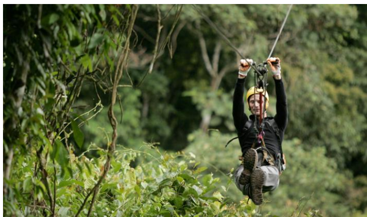
Imagen referencial de la experiencia