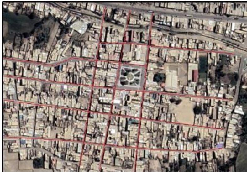
FOTOGRAFÍA AÉREA DE PAIJÁN CENTRO