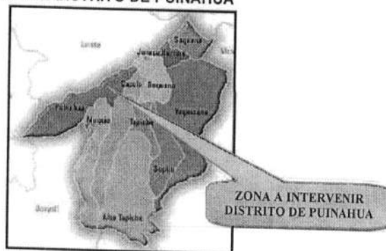
MAPA N° 02

El Área de Estudio para el proyecto es el área de influencia donde se ubican las infraestructuras públicas y privadas de la comunidad de San Juan de Paucar.