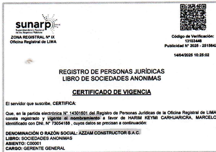
Imagen N° 01.- Documento extraído de la página 6 del postor CONSORCIO PERÚ

A continuación, se muestra lo adjunto por el postor: