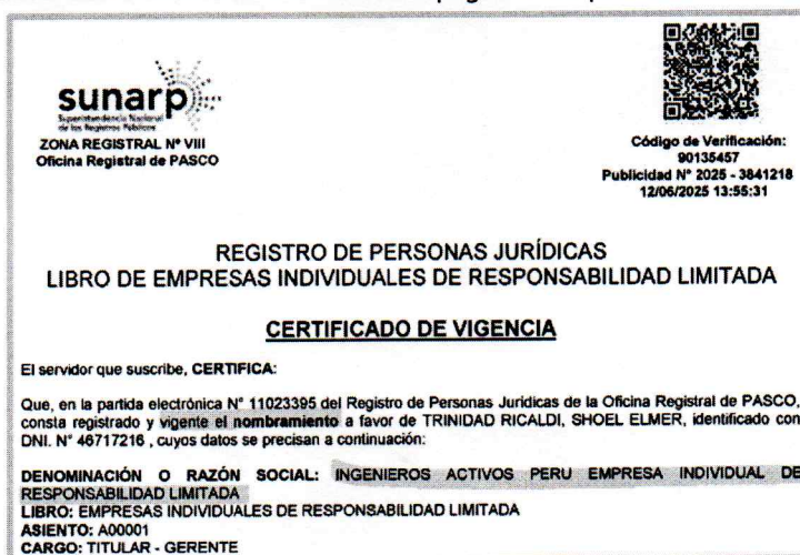
Imagen N° 02.- Documento extraído de la página 16 del postor CONSORCIO PERÚ

Con la finalidad de esclarecer lo mencionado líneas arriba, a continuación, se muestra una vigencia de poder otorgado por la SUNARP para acreditar que el representante legal cuenta con dichos poderes concedidos: