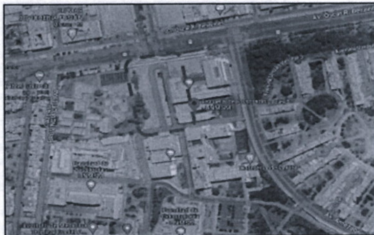
Ilustración 1: Vista Satelital del Terreno a intervenir

6.2.e. El servicio se desarrollará en la zona ya se encuentra ubicada detrás del edificio existente del Centro Pre, dentro del Campus de la Ciudad Universitaria de San Marcos, tal como se aprecia en la siguiente imagen: