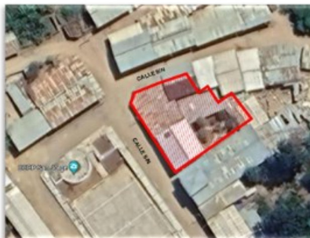
Figura 1. Micro localización del predio para el establecimiento de salud San Jorge