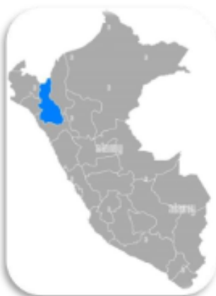
Vista a Nivel Nacional