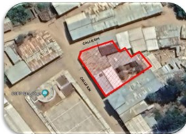
Ubicación del área del proyecto