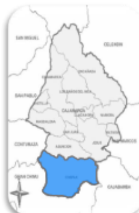
Vista a Nivel Distrital