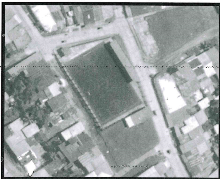
Ilustración 1: Ubicación Geográfica del Proyecto

Distrito : San Juan Bautista Provincia : Maynas Región : Loreto País : Perú