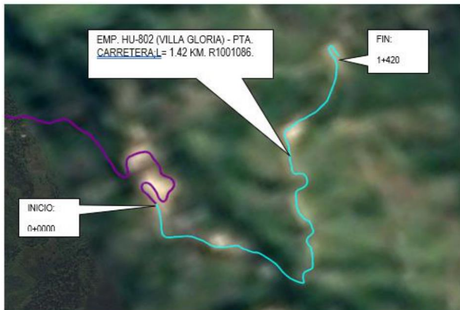
TRAMO 2: EMP. HU-802 (VILLA GLORIA) - PTA. CARRETERA; L= 1.42 KM. R1001086.

"Decenio de la Igualdad de Oportunidades para Mujeres y Hombres" "Año de la unidad, la paz y el desarrollo"