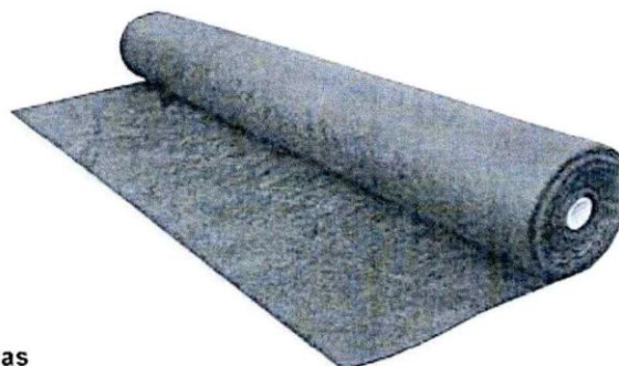
Gráfico N° 1: Rollo (Imagen referencial)