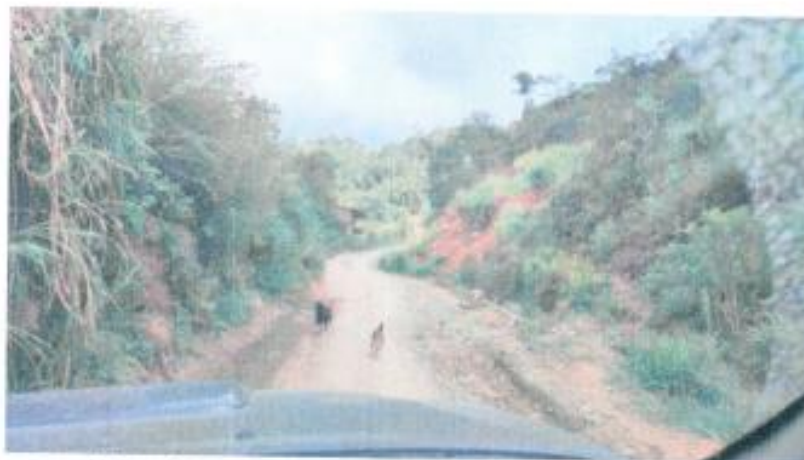
Vista del camino interurbano La Florida – Santa Rosa