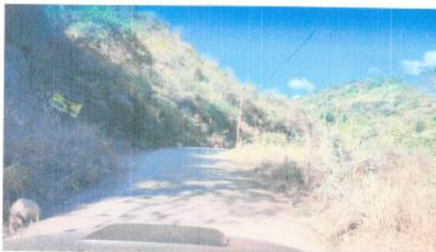
Vista del camino interurbano Morro Solar – San Miguel de Las Naranjas