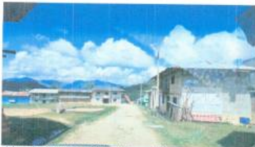
Vista del camino interurbano CP La Palma – El Nogal (Entrada Caserio Nogal)