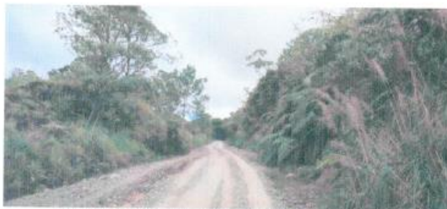
Vista Del Camino Interurbano Santa Rosa – San Andres