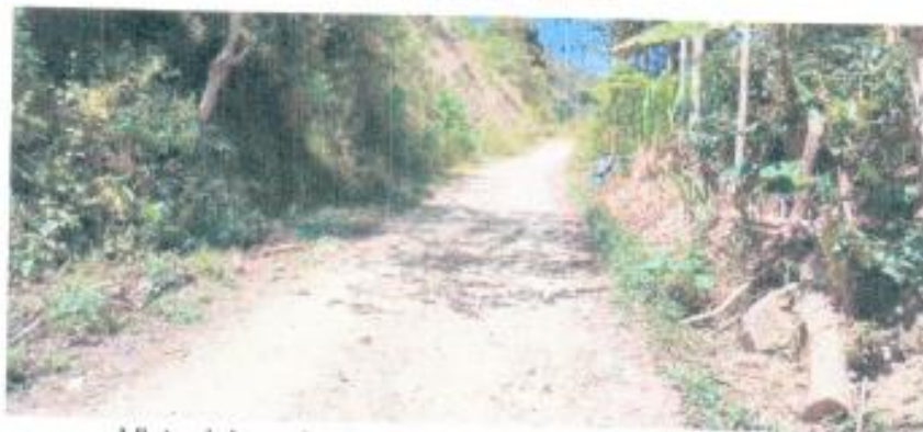
Vista del camino interurbano El Edén – Las Malvinas