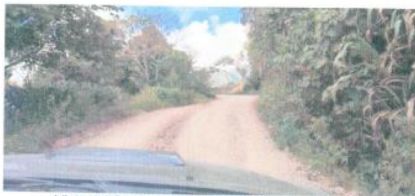
Vista del Camino Interurbano El Balsal – La Florida