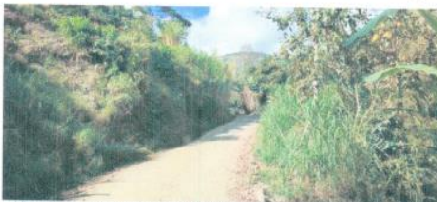
Vista del camnino interurbano San Miguel De Las Naranjas – Santa Fe