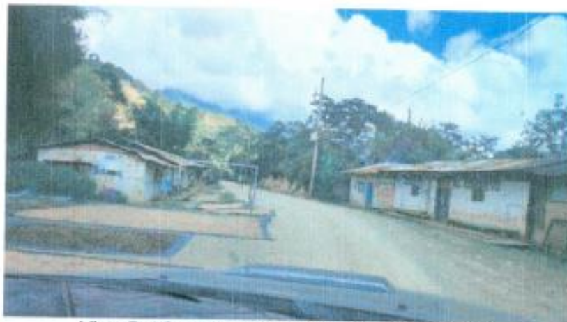
Vista Del Camino Interurbano Miraflores El Balsal