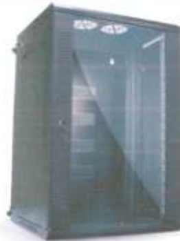
7. REQUISITOS QUE DEBERA CUMPLIR EL PROVEEDOR

"Año del Bicentenario, de la consolidación de nuestra independencia, y de la conmemoración de las heroicas batallas de Junín y Ayacucho"