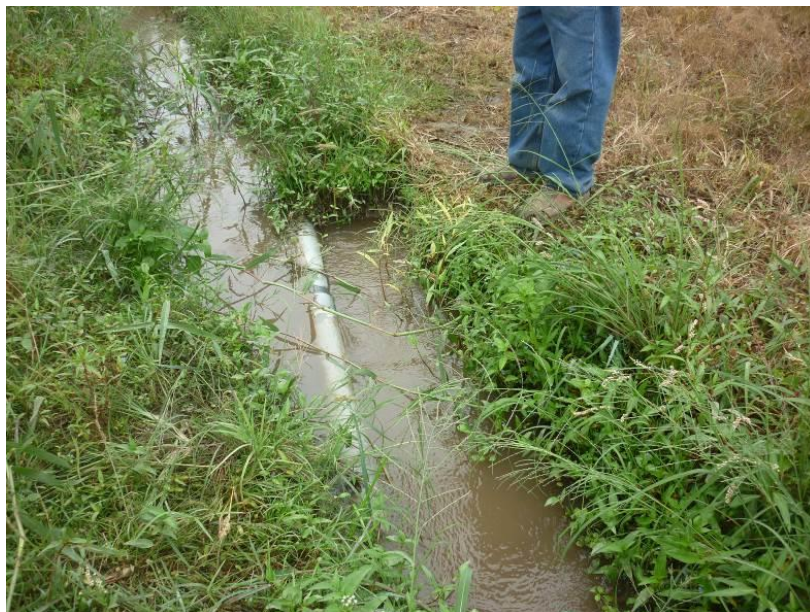
IMAGEN N°05. Se observa la tubería de conducción en malas condiciones ya que fue colocada por la población del Sector.