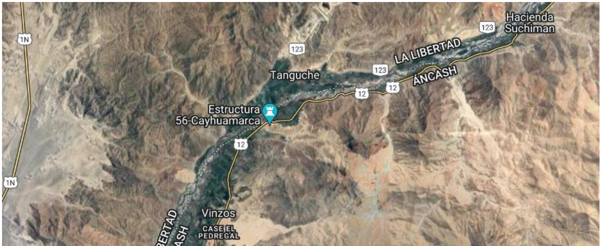
IMAGEN 02: UBICACION DEL CENTRO POBLADO DE TANGUCHE

Para llegar a Tanguche, partiendo de la ciudad de Trujillo (Ovalo Miguel Grau), capital del departamento de La Libertad, hay que desplazarse desde las avenidas asfaltadas La Marina, pasando Ov. La Marina y siguiendo La Panamericana norte por un lapso de 55min. hasta Viru, luego de desplazarse aprox. 15.0 Km, por la misma PANAMERICANA NORTE (asfaltado) se llega a el distrito de Chao y de ahí se recorrerá aprox. 35 km por una vía de asfalto hasta llegar al sector Tanguche en cuestión.