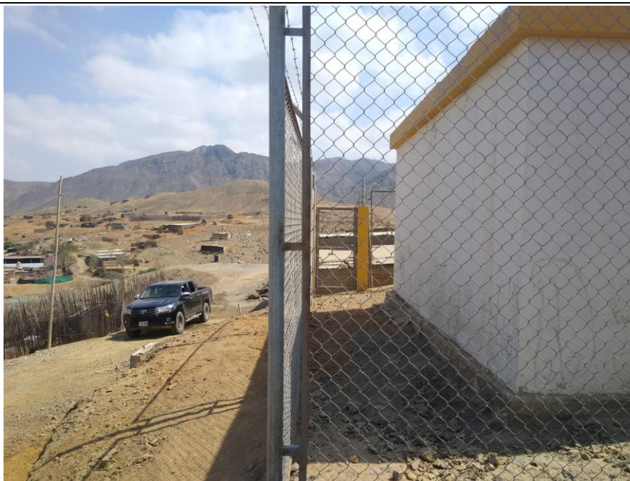
IMAGEN N°06. Estado actual del reservorio, donde se almacena el agua