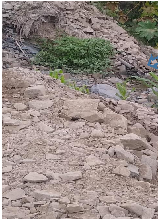
IMAGEN N°04. Se observa la tubería de conducción en colapsada por que fue afectada por el fenómeno Yacu del 2023.