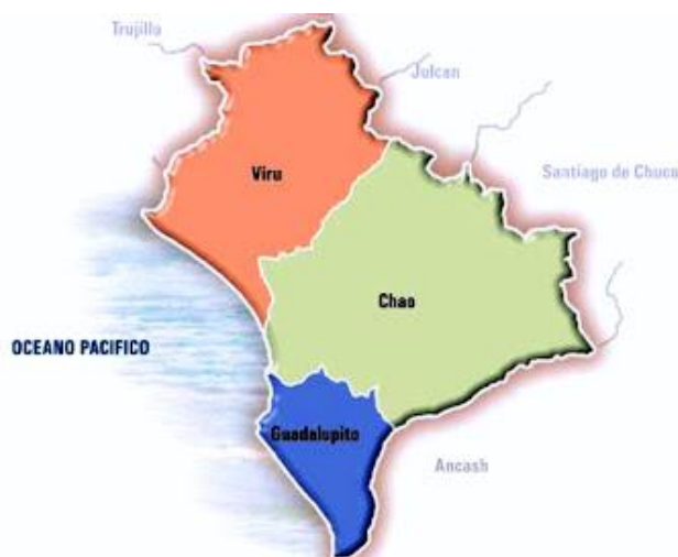
IMAGEN 01: UBICACION DEL DISTRITO DE CHAO