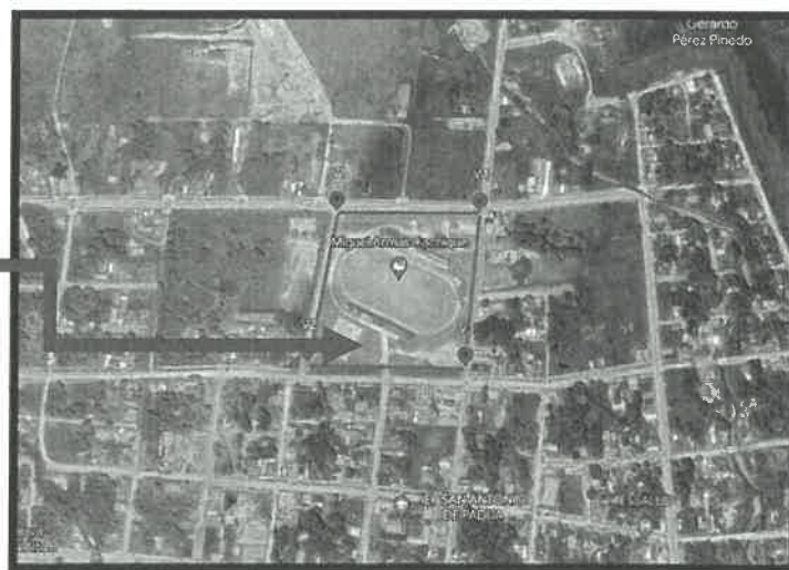
Ubicación del proyecto, vista Satelital