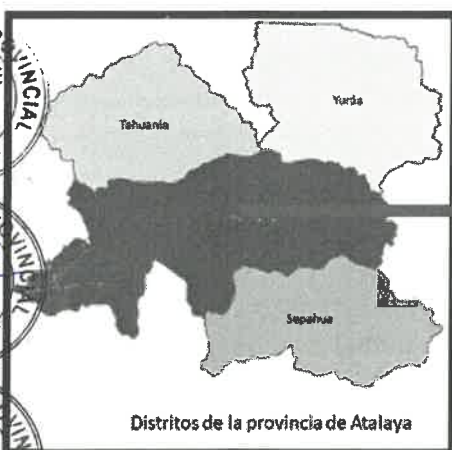
Mapa de la localización de la ciudad de Atalaya