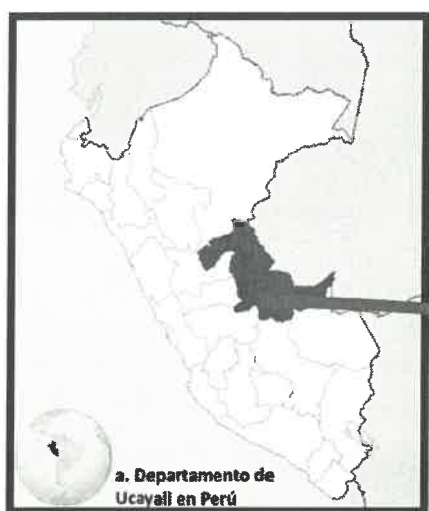
Mapa de macro localización