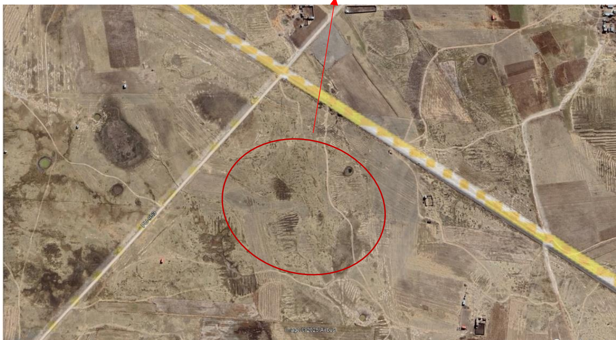
Ubicación del Proyecto: Imagen Satelital

Ubicación de área de influencia del proyecto.