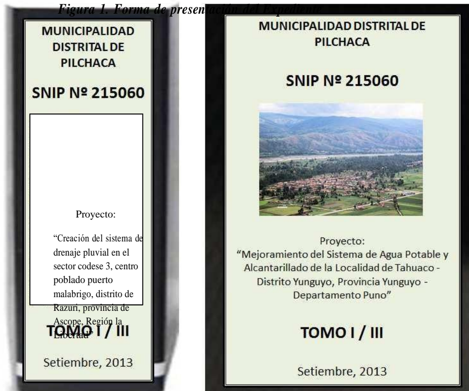
Figura 1. Forma de presentación del Expediente

Los expedientes deberán ser presentados en archivadores de palanca de lomo ancho. Cada archivador deberá considerar una carátula en la parte frontal y en lomo del mismo, para una rápida verificación. Se recomienda que dichas carátulas, deberán indicar como mínimo, lo indicado en la figura 1.