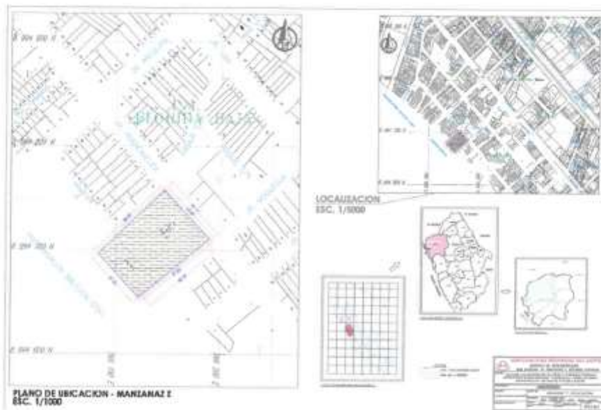
Imagen N.º 01: Plano de Ubicación del Complejo Deportivo.