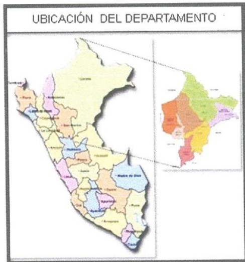
Imagen N°01: Marco de localización

Rio Amazonas Bosque Tropical, Patrimonio Natural del Mundo