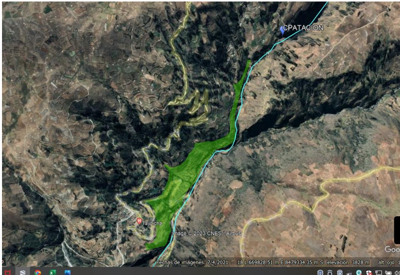
Grafico N° 02: área de influencia.

En el siguiente cuadro se puede apreciar los 53.4 hectáreas de terreno con fines de producción de Maiz Y Papa.