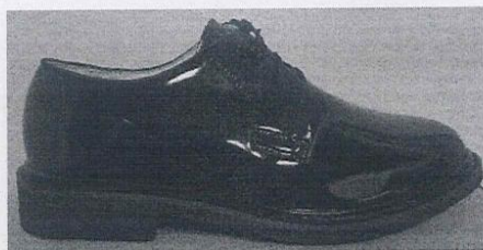
FOTO REFERENCIAL DE CALZADO CORFAN