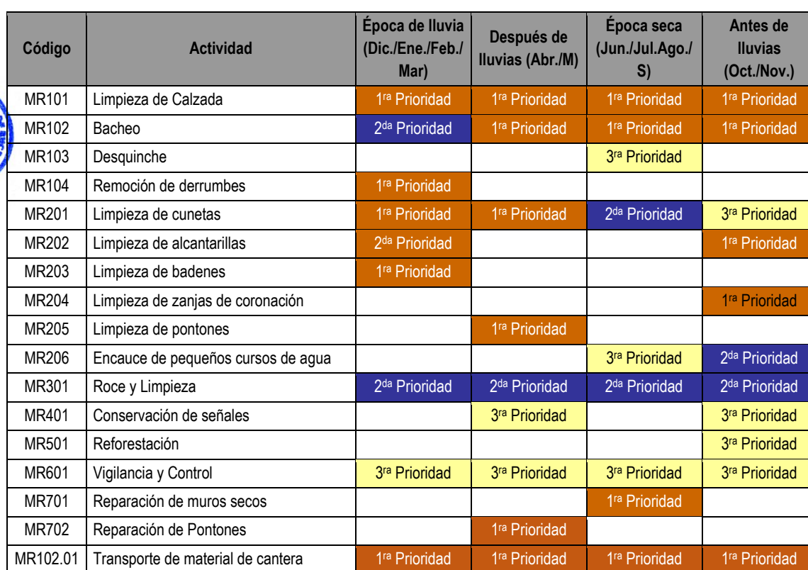
CUADRO N° 01

De acuerdo a lo anterior, se distribuye las actividades a ser desarrolladas durante el año. El cuadro N° 01 indica las prioridades establecidas.