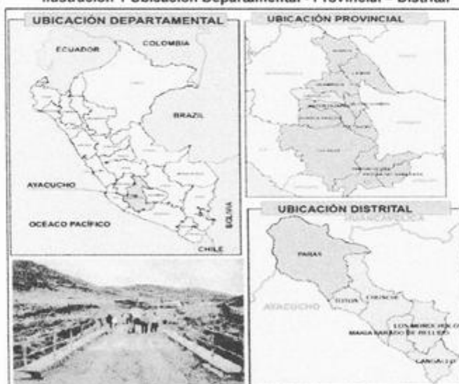
Ilustración 1 Ubicación Departamental - Provincial – Distrital