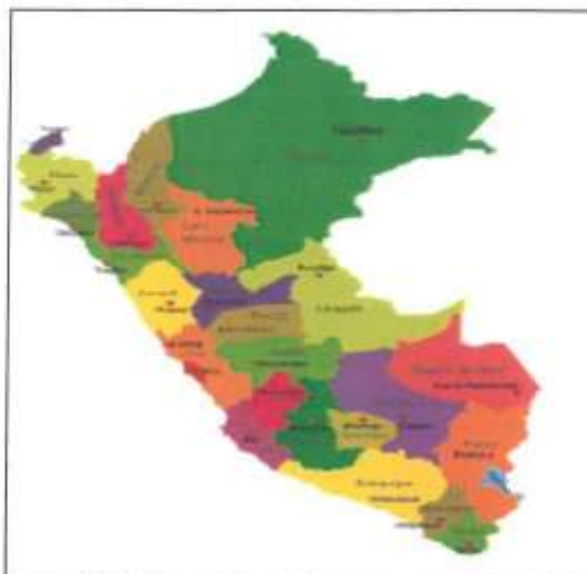
Mapa Político de la Región Cajamarca y sus provincias.