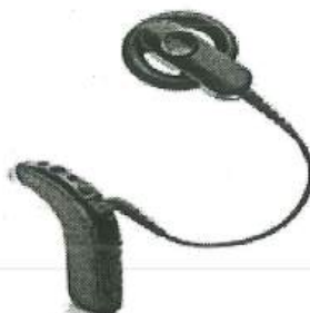
Fig 1.: El diagrama es netamente referencial