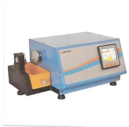
IMAGEN REFERENCIAL DEL ITEM 01