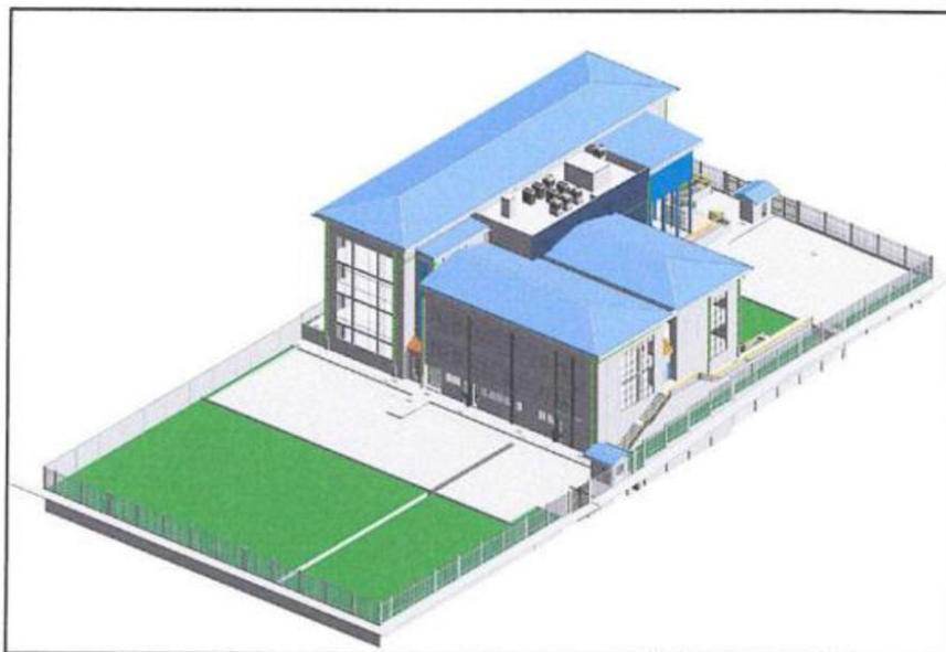
PROYECTO A EJECUTAR