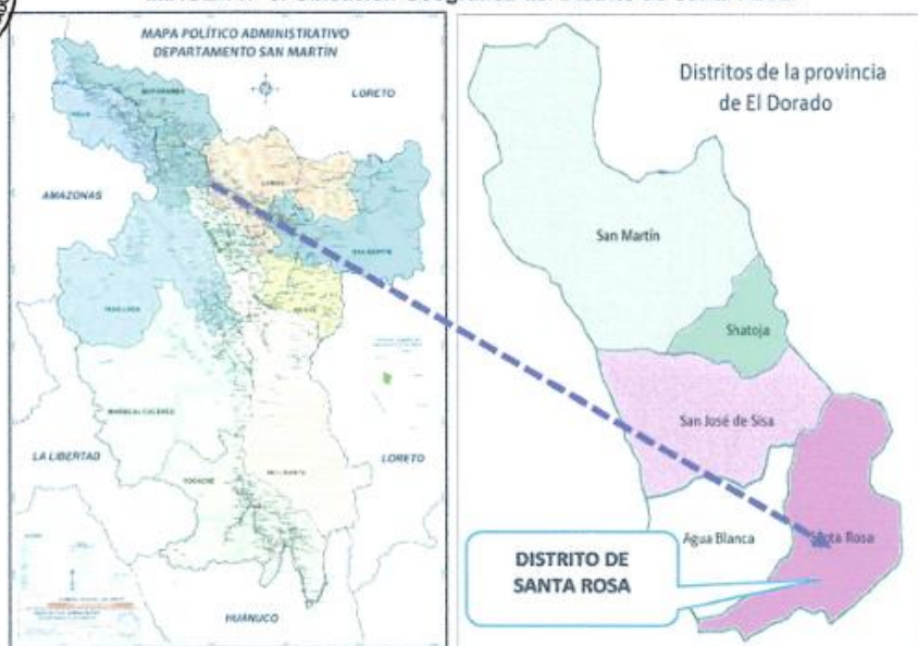
IMAGEN N° 4: Ubicación Geográfica del Distrito de Santa Rosa.

TÉRMINOS DE REFERENCIA CONSULTORÍA DE OBRA - SUPERVISIÓN