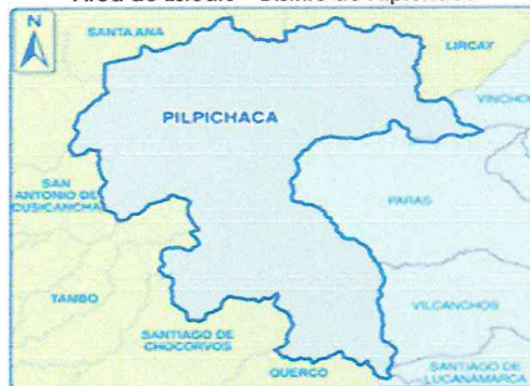
Área de Estudio – Distrito de Pilpichaca

El proyecto se ubicará en la localidad de Pilpichaca, distrito de Pilpichaca, Provincia de Huaytará, Región Huancavelica de acuerdo al equipo técnico, se concluye que la localidad se encuentra apta para intervenir. A continuación, se muestra la macro localización del proyecto.