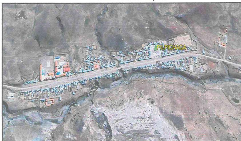
Plano 1 Localización del Proyecto

La ubicación del Proyecto: "MEJORAMIENTO DE LOS SERVICIOS OPERATIVOS O MISIONALES INSTITUCIONALES EN LA CAPACIDAD TÉCNICA OPERATIVA DE POOL DE MAQUINARIA PESADA EN LA MUNICIPALIDAD DISTRITAL DE PILPICHACA DISTRITO DE PILPICHACA DE LA PROVINCIA DE HUAYTARÁ DEL DEPARTAMENTO DE HUANCAVELICA", se describe en el siguiente cuadro: