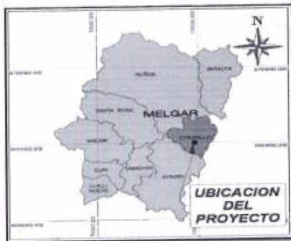
Figura N° 2: MAPA DE MICRO LOCALIZACIÓN