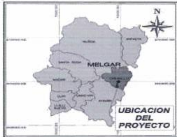
Figura N° 2: MAPA DE MICRO LOCALIZACIÓN