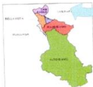
Figura N° 2: Mapa del departamento de San Martín y sus provincias

Términos de Referencia de la Contratación de la Ejecución de la obra: "Creación de los Servicios Públicos de Integración Económica y Social en el Local Comunal de la Localidad de Buenas Aires Distrito de Bellavista de la Provincia de Bellavista del Departamento de San Martín" con CUI N°2586173