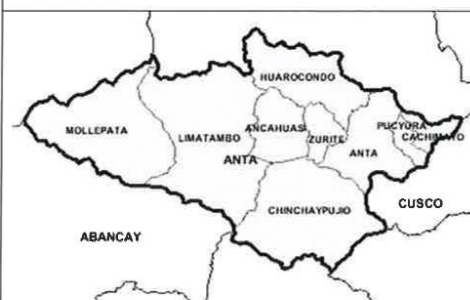
IMAGEN 3 Mapa de la provincia de Anta