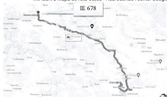
IMAGEN 6 Mapa de ruta Cusco- Huaroscondo