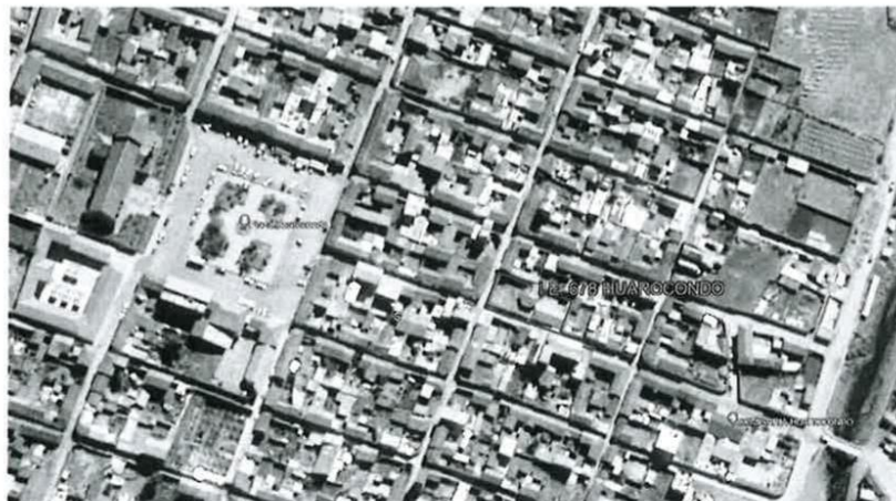
b) IMAGEN 5 Vista aérea del terreno

El acceso a la zona del proyecto es mediante: