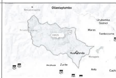
IMAGEN 4 Mapa del distrito de Huaroscondo