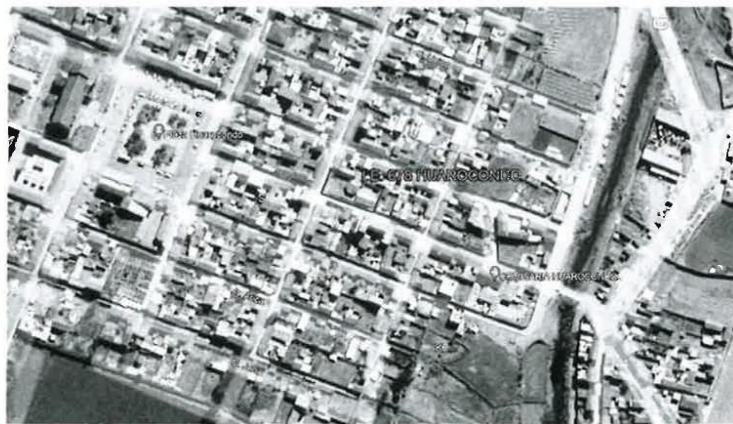
IMAGEN 7 vista aérea del centro Poblado de Huaroscondo

Respecto al ENTORNO INMEDIATO DEL PROYECTO, destaca la Plaza de armas de Huaroscondo y la vía Principal interoceánica Sur 110