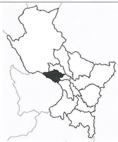
IMAGEN 2 Mapa de región del Cusco