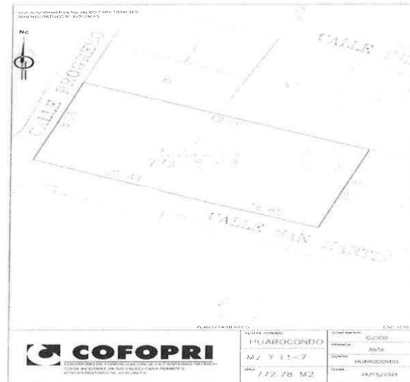
IMAGEN 8 Polígono del predio inscrito en registros públicos