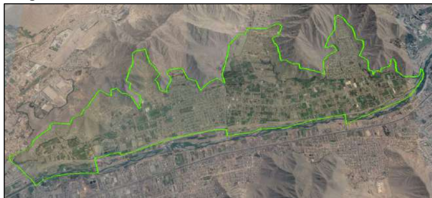
Figura N° 1 : Vista del área de influencia la zona de intervención

El área de influencia, es el ámbito del proyecto "Ampliación de los servicios de agua potable y alcantarillado para nuevas habilitaciones del Esquema Carapongo - Sectores 136 y 137 - Distrito de Lurigancho, Provincia y Departamento de Lima".