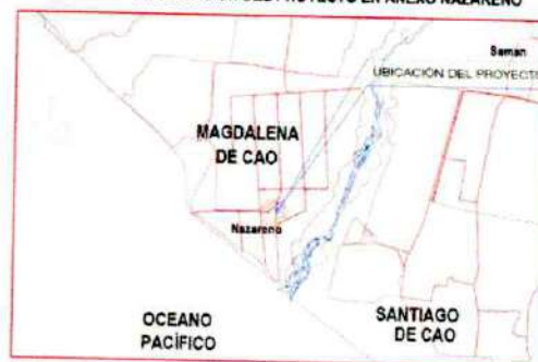
IMAGEN N° 04: UBICACIÓN DEL PROYECTO EN ANEXO NAZARENO