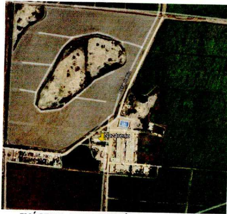
IMÁGEN 2: LOCALIZACIÓN DEL PROYECTO.

Las vías de acceso a la obra, se realiza mediante transporte terrestre. La carretera es asfaltada en dirección al norte Peruano Trujillo – Huanchaco – Santiago de Cao – Nazareno, tal como se demuestra en el siguiente cuadro.