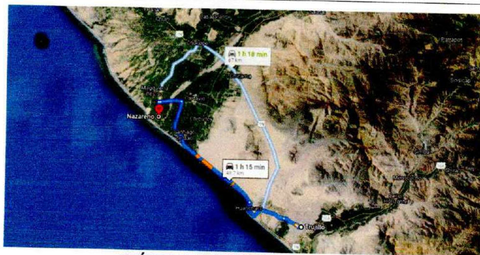
IMÁGEN 3: RECORRIDO DE ACCESO

Municipalidad Distrital de Magdalena de Cao.