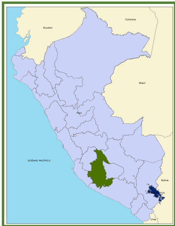
Ilustración 01: Ubicación de la región Ayacucho