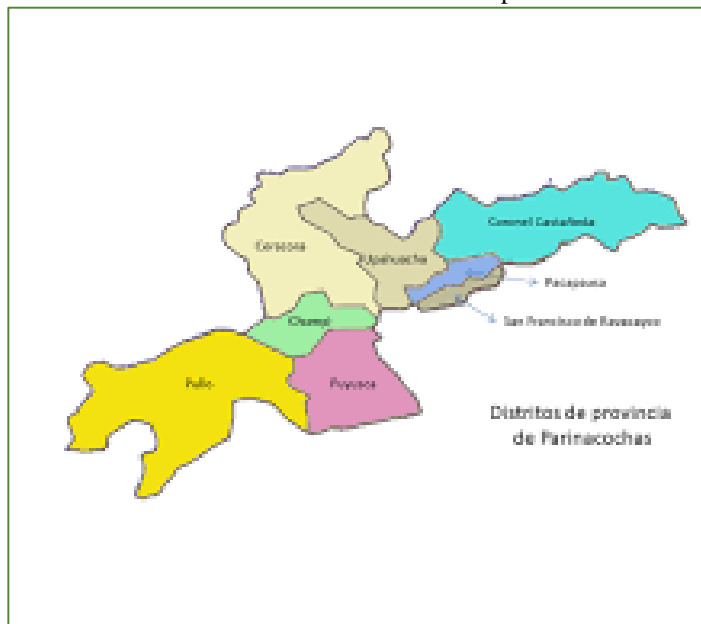
Ilustración 03: Ubicación del distrito de Chumpi