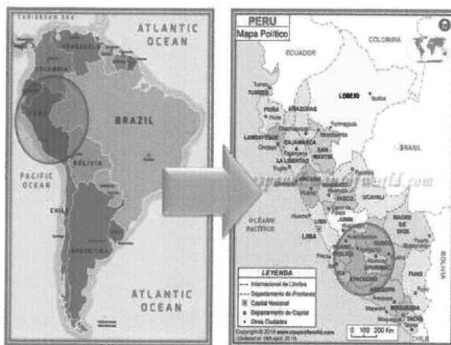
FIGURA N° 01 - MAPA DE UBICACIÓN MACRO