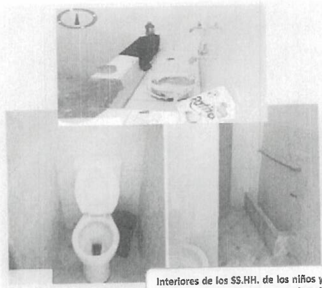
Interiores de los SS.HH. de los niños y docentes (Se cuenta con dos inodoros)