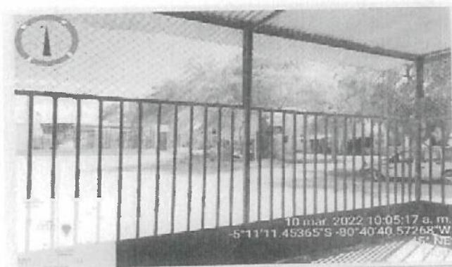
Cerco Perimétrico y enmallado de la I.E