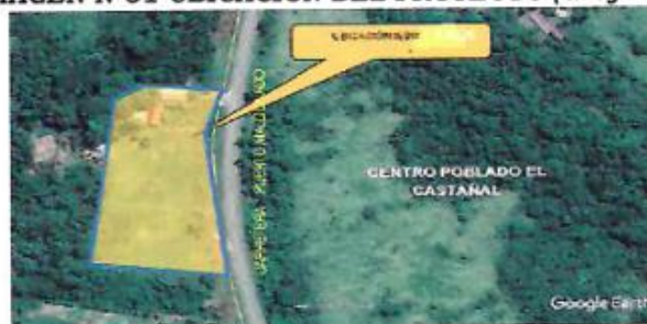
IMAGEN N°01 UBICACIÓN DEL PROYECTO (Grafico)

Nota: La atención de almacén de obra es: lunes a viernes 7:00 am hasta 5:30 pm y sábados de 7:00 am hasta 1:00 pm