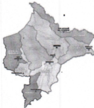
UBICACIÓN DE LA PROVINCIA REQUENA