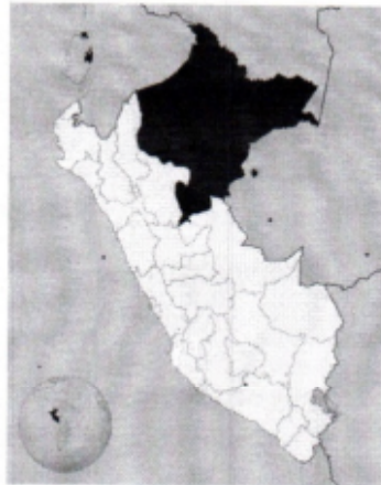
UBICACIÓN DE LA REGION LORETO