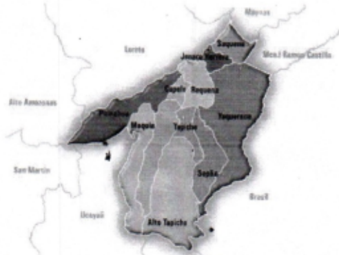
UBICACIÓN DEL DISTRITO DE PUINAHUA