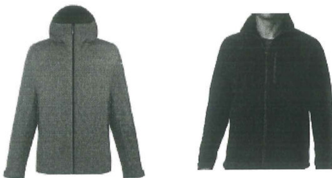
Izquierda: casaca de campo (exterior). Derecha chaqueta (interior) Fotos y colores referenciales