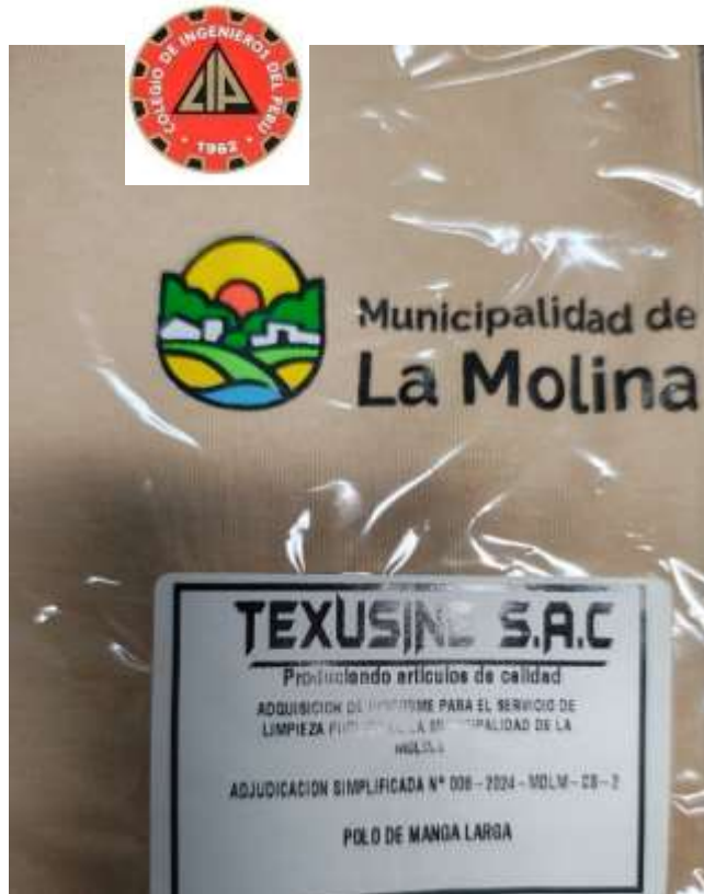
Ilustración 1 POLO DE ALGODON PIMA CUMPLE LAS ESPECIFICACIONES TECNICAS POSTOR 01