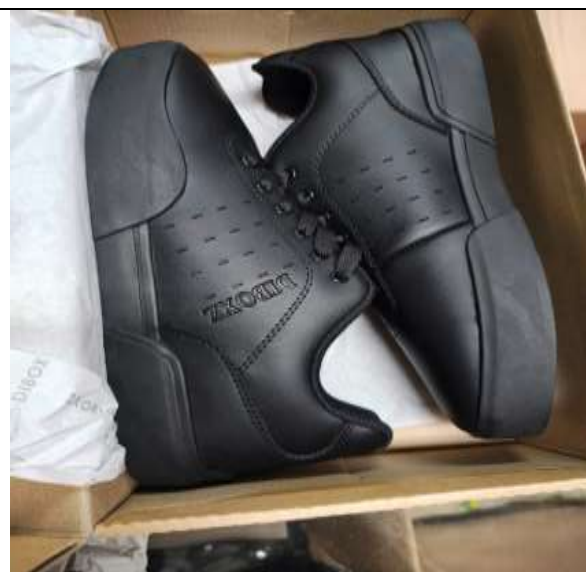
Ilustración 14 ZAPATILLAS DE CUERO CUMPLE LAS EE.TT. DEL POSTOR 04