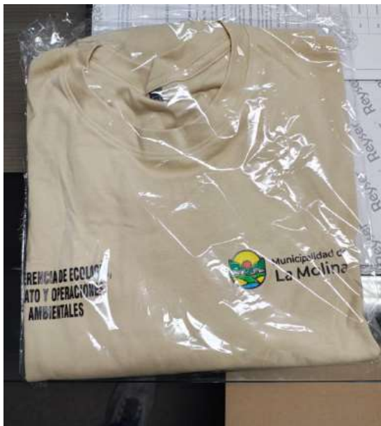
Ilustración 5 POLO DE ALGODON PIMA CUMPLE DEL POSTOR 02