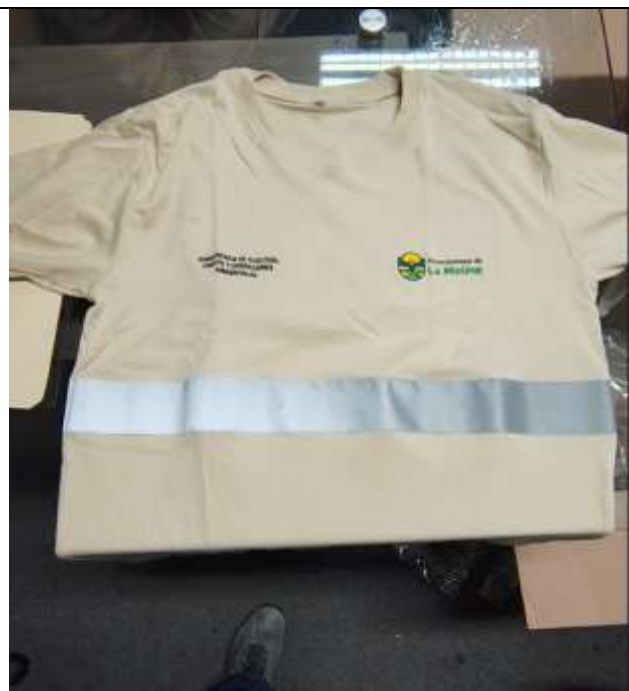
Ilustración 11 POLO DE ALGODON CUMPLE LAS EE.TT. DEL POSTOR 04