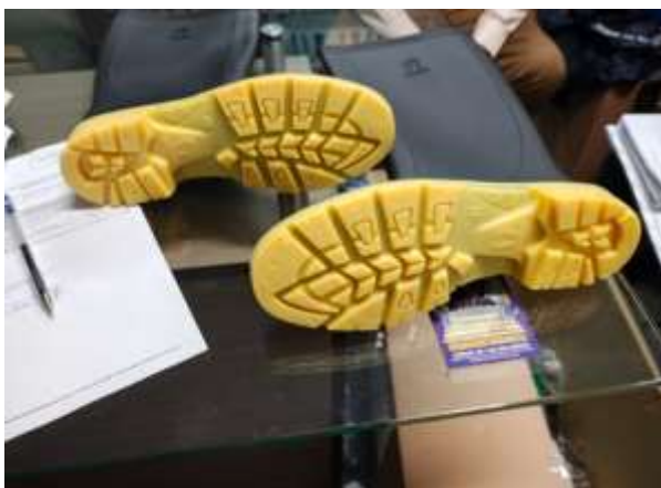
Ilustración 10 SON BOTAS DE JEBE CAÑA ALTA CUMPLE LAS EE.TT. DEL POSTOR 02