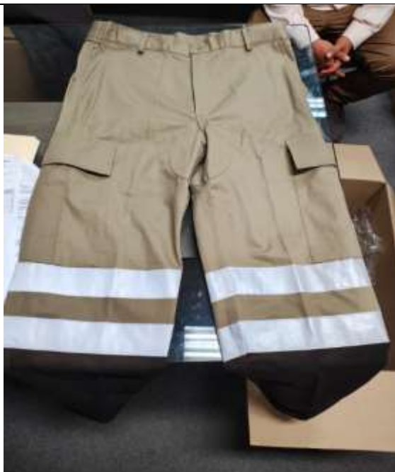
Ilustración 6 PANTALON CON CINTA REFLECTIVA CUMPLE LAS EE.TT. DEL POSTOR 02