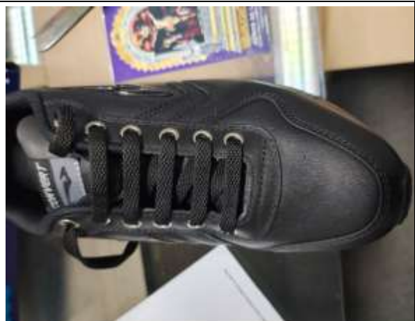
Ilustración 9 ZAPATILLA CUMPLE LAS EE.TT. DEL POSTOR 02