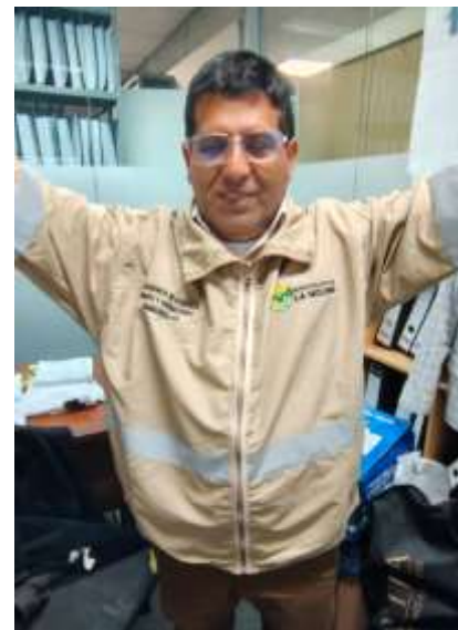
Ilustración 4 CASACA IMPERMEABLE DE POSTOR 01 CUMPLE