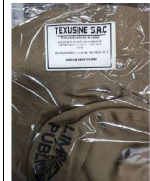
Ilustración 3 POSTOR 01 GORRO TIPO ARABE CUMPLE LAS EE.TT.