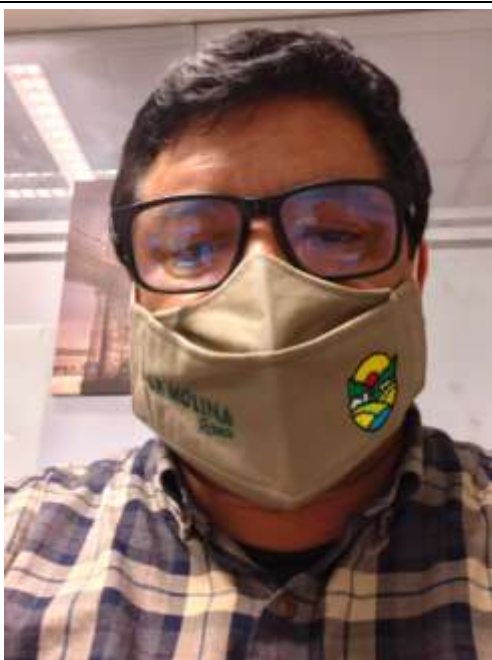
Ilustración 8 MASCARILLA DE ALGODON CUMPLE LAS EE.TT. DEL POSTOR 02