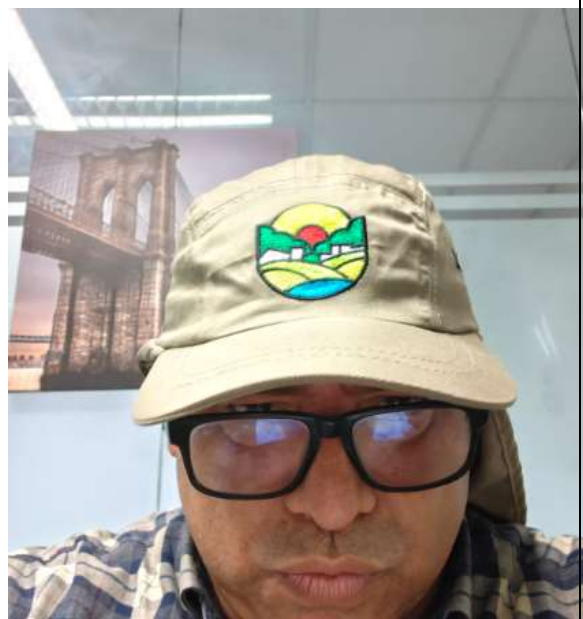
Ilustración 7 GORRO TIPO ARABE CUMPLE LAS EE.TT. POSTOR 02