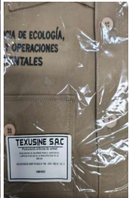
Ilustración 2 CAMISACO CUMPLE LAS EE.TT. ES EL CAMISACO