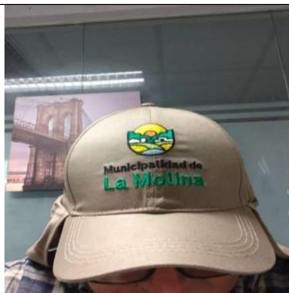
Ilustración 13 GORRO ARABE CUMPLE LAS EE.TT. DEL POSTOR 04