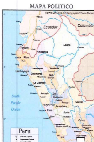
PROVINCIA DE CHICLAYO

OBRA: "MEJORAMIENTO DEL SERVICIO DE TRANSITABILIDAD VEHICULAR Y PEATONAL EN EL P.J. SAN SEBASTIÁN DISTRITO DE CHICLAYO - PROVINCIA DE CHICLAYO - DEPARTAMENTO DE LAMBAYEQUE"- CUI N° 2412415.