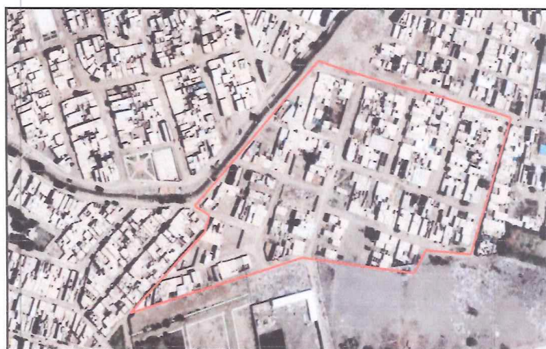
Imagen N° 02: UBICACIÓN DEL PROYECTO