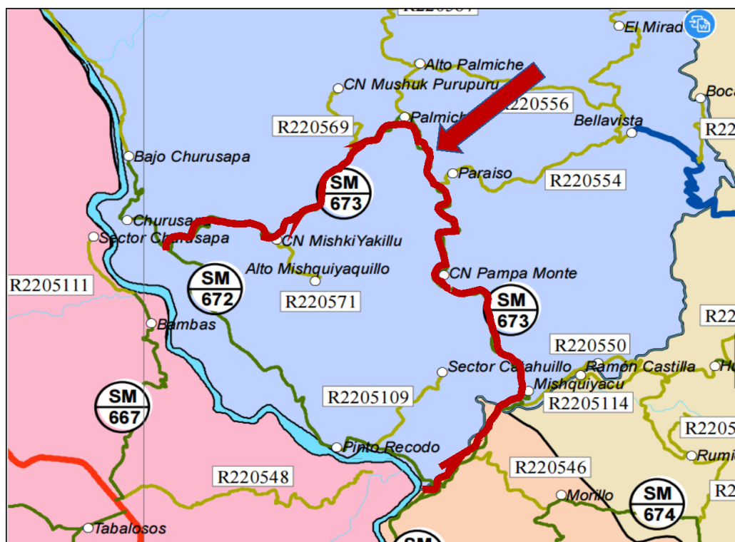
Fig. 01. EMP. SM-672 (PTE. CHUMBAQUIHUI) - MISHQUIYACU - PAMPAMONTE - PALMICHE - MISHQUIYAQUILLO - EMP. SM-672.

Servicio de ejecución del mantenimiento rutinario del camino vecinal, Tramo: EMP. SM-672 (PTE. CHUMBAQUIHUI) - MISHQUIYACU - PAMPAMONTE - PALMICHE - MISHQUIYAQUILLO - EMP. SM-672.