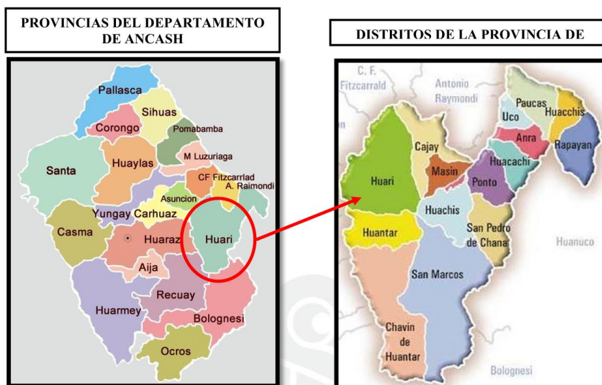
Grafica N° 02. Esquema de Micro Localización de la localidad de A

SUB GERENCIA DE OBRAS Y MANTENIMIENTO "Año del Bicentenario, de la consolidación de nuestra Independencia, y de la conmemoración de las heroicas batallas de Junín y Ayacucho".