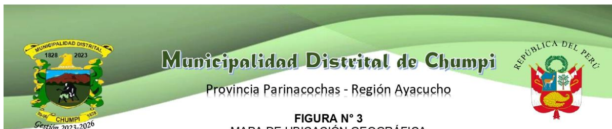
FIGURA N° 3 MAPA DE UBICACIÓN GEOGRÁFICA