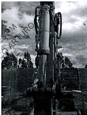
Cilindro hidráulico vástago quiñado del brazo

"Decenio de la Igualdad de Oportunidades para mujeres y hombres" "Año del Bicentenario de la consolidación de nuestra independencia y de la conmemoración de las heroicas batallas de Junín y Ayacucho"